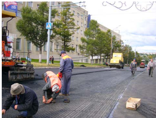
Раскатывание георешетки AR1