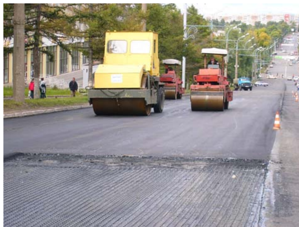
Укладка асфальтобетонного покрытия