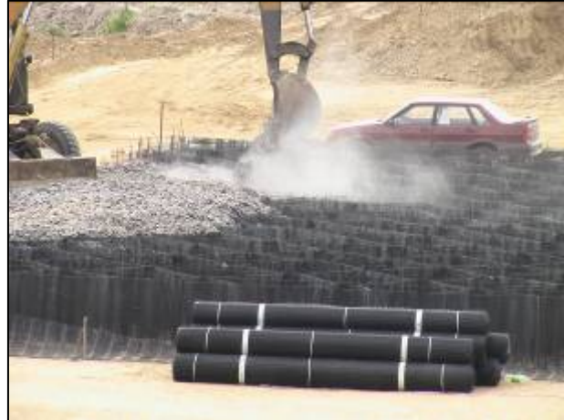
Устройство и заполнение геосот Тенсар