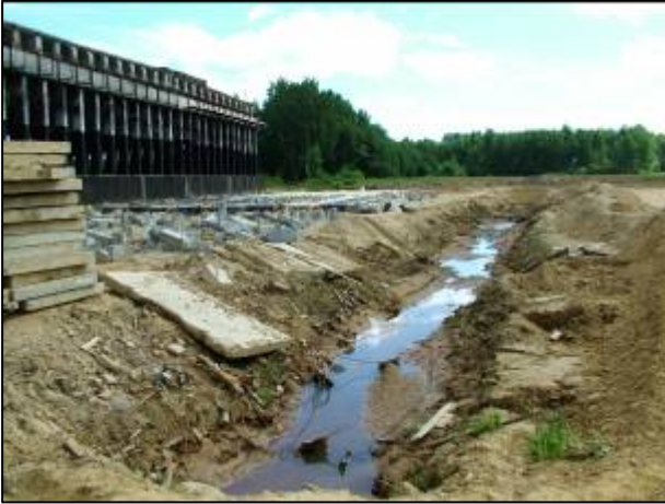
Путепровод через ж/д пути на участке КАД