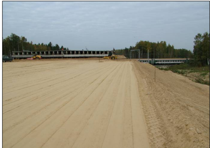
Готовая насыпь перед устройством дорожной одежды