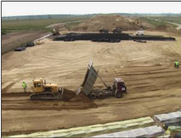
Послойная отсыпка тела подходной насыпи